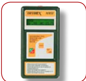
Fuktmätare Tramex MRH