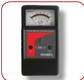
Fuktmätare Tramex CME4