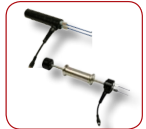
1 st stifthuvud samt 1 st hammarelektrod medföljer.